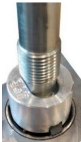
Рисунок 3 – Установка направляющего стержня в сборе с фрезой на поверхность седла клапана

При обработке фасок седел клапанов вращение направляющего стержня в сборе с фрезой может выполняться воротком, установленным в отверстие направляющего стержня или воротком с переходником, установленным на присоединительный квадрат в верхней части стержня.