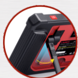
Вращающаяся на 180° ручка